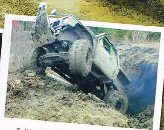
Petite déception pour Ors et Philippe, qui ne terminent que 15e... C'est le métier qui rentre !