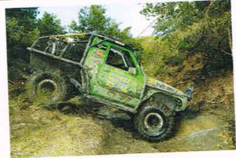
Autre Nissan, autre course, car les frères Furet, ici à l'image faisaient équipe avec les frères Doucet. Ils terminent respectivement 14e et 16e.