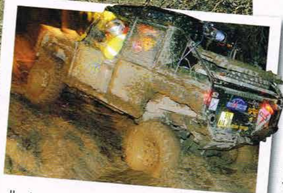
Il l'équipage Crisi et Mendioudou a fait le forçing durant l'épreuve de nuit.

vous offre les plus belles photos de L'X-TREM CHALLENGE