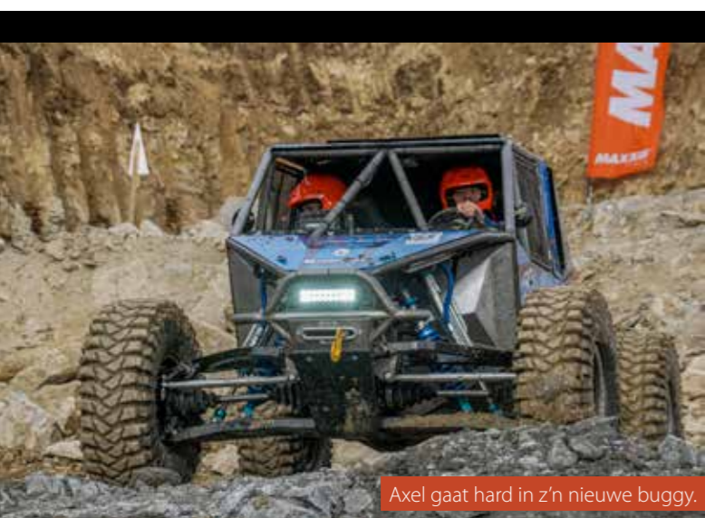
Axel gaat hard in z'n nieuwe buggy.