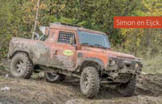
Simon en Eijck.