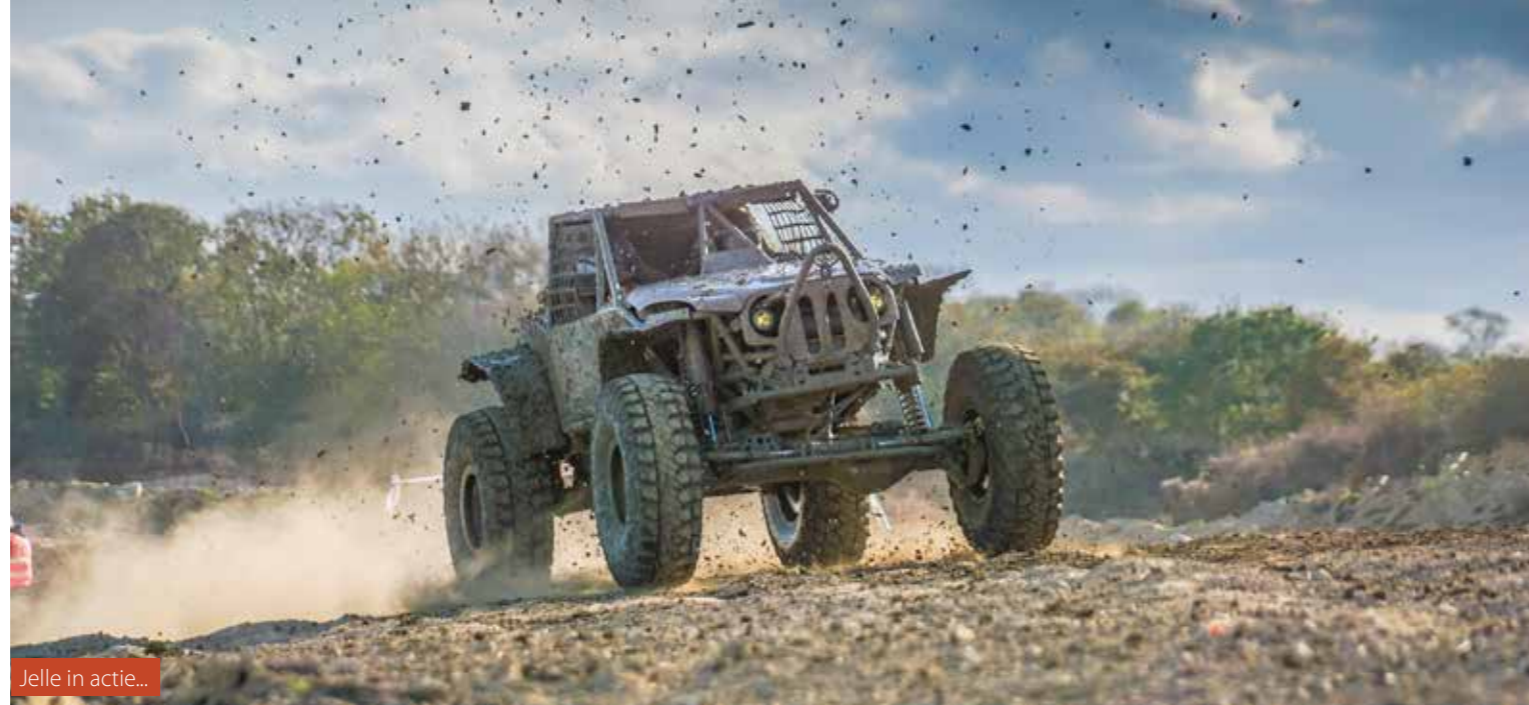
Jelle in actie...