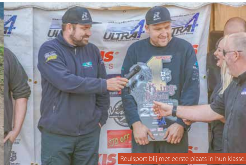
Reulsport blij met eerste plaats in hun klasse...