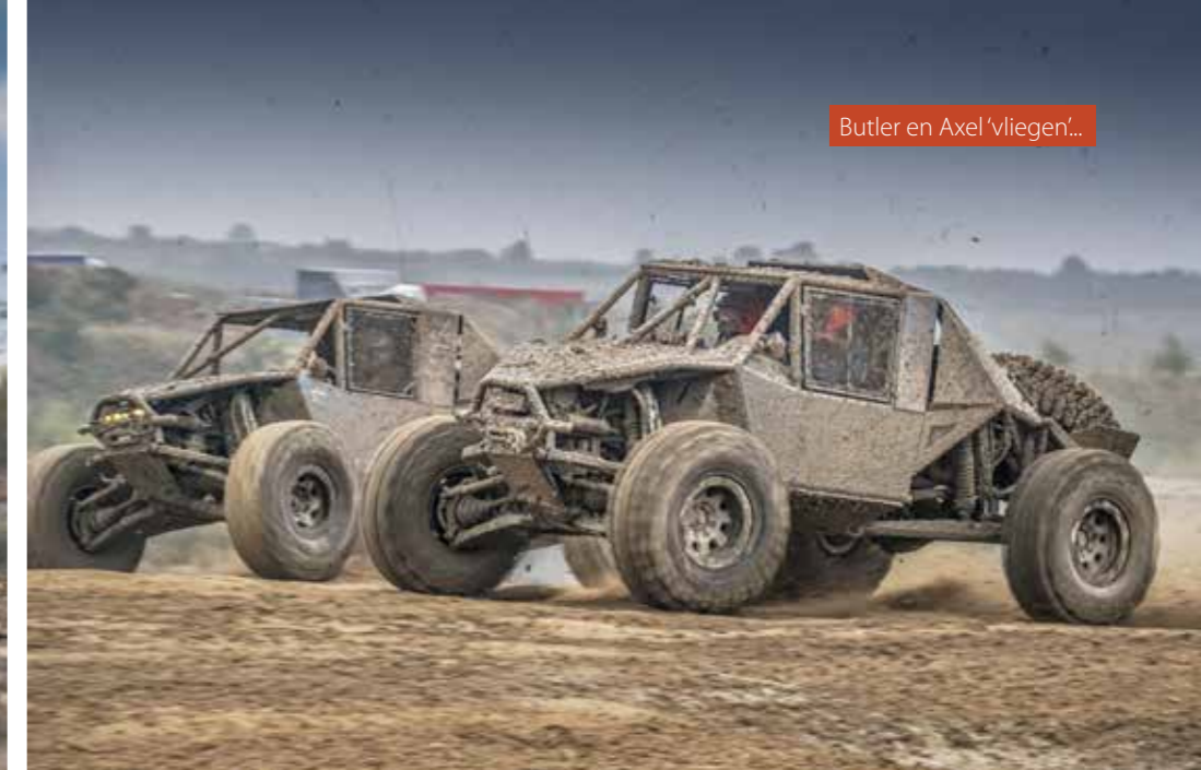
Butler en Axel 'vliegen'...