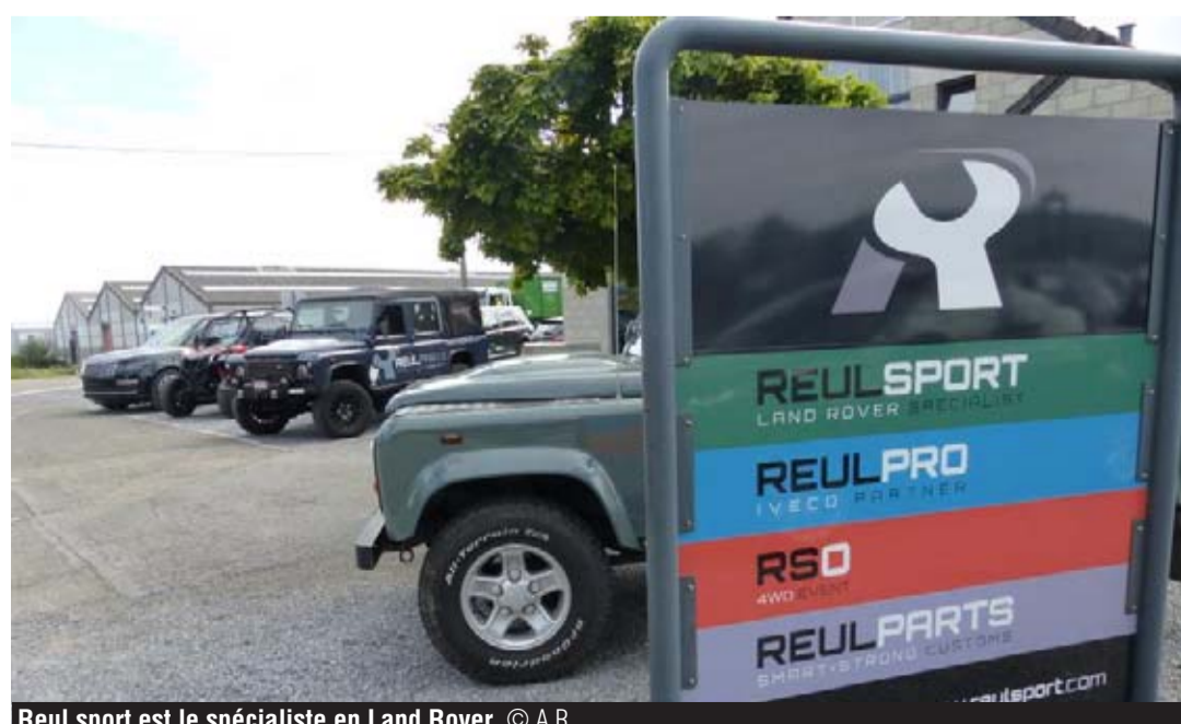
Reul sport est le spécialiste en Land Rover.